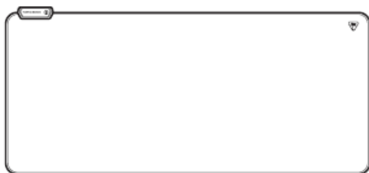
Ultra-Wide RGB Gaming Mousepad Tapis de souris de jeu RVB ultra-large